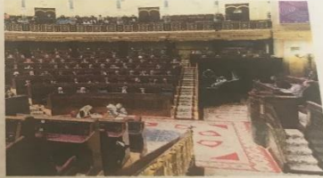
Sesión en el Congreso de los Diputados.