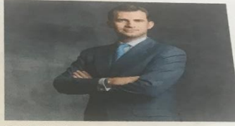
El rey Felipe VI.