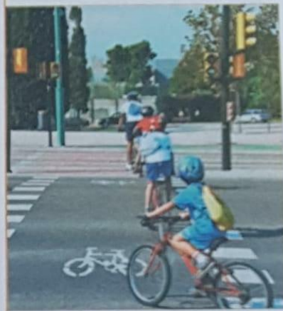
Explica por qué estas personas tienen una conducta responsable para conservar la salud.